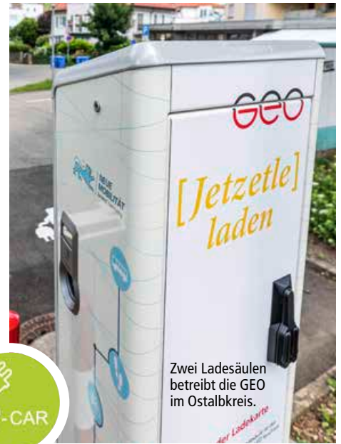
Zwei Ladesäulen betreibt die GEO im Ostalbkreis.

→ Mehr Infos zur Ladekarte gibt es auf www.geo-energie-ostalb.de/aktuelles/jetztleladen