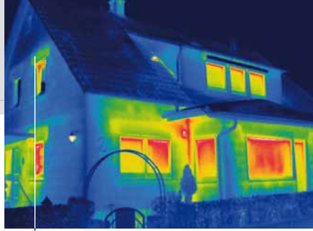
Die Thermografie macht deutlich, wo an Ihrem Gebäude ein erhöhter Wärmeverlust stattfindet – hier z. B. am Rollladenkasten.